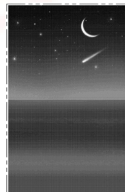
D685,385 設計專利 (桌布)