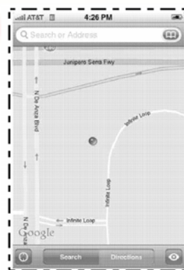
D649,973 設計專利 (圖形化使用者介面)