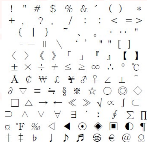
圖 1 修正前